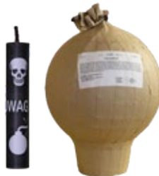
Abbildung 1: Für den privaten Gebrauch verbotene Feuerwerkskörper.

Auf dem Gegenstand oder auf der Verpackung muss die Gebrauchsanweisung angebracht sein.