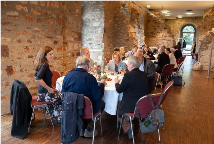
Abendessen und Get Together