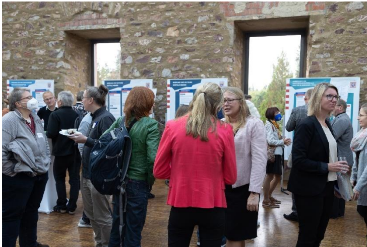
Gespräche an den ausgearbeiteten Maßnahmensteckbriefen