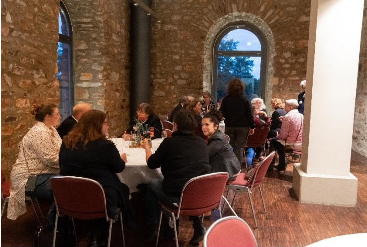
Zum Abschluss konnten sich die Teilnehmenden in lockerem Rahmen bei Essen und Getränken austauschen.